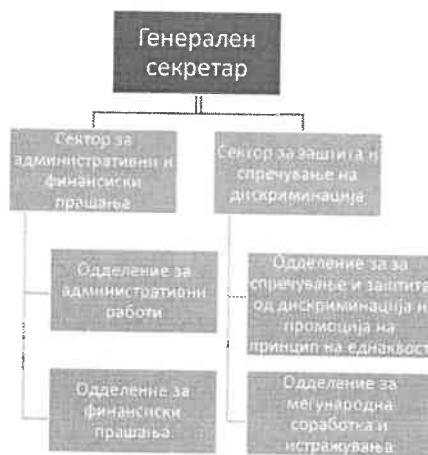
Органограм на службата на КСЗД

Стручната служба на КСЗД се формира заради вршење на стручните, административните и техничките работи (член 22 од Законот). Исто така вработените во стручната служба на КСЗД се со статус на административни службеници и за нив се применуваат одредбите во согласност со Законот за административни службеници. Потребата од стручна служба се јавува поради зголемените надлежности на КСЗД, како и фактот дека со новиот закон членовите имаат статус на именувани лица кои функцијата ја вршат професионално со определен мандат. Стручната служба треба да биде столб на КСЗД, како за сегашниот така и за идните состави. Поради тоа е потребно да биде компетентна, ефикасна и добро образована. Ангажирање на стручната служба оди во прилог на независноста на КСЗД како и потребата од постоење на институционална меморија. Со воспоставувањето на КСЗД во 2021 година, започна и воспоставувањето на нејзината стручна служба.